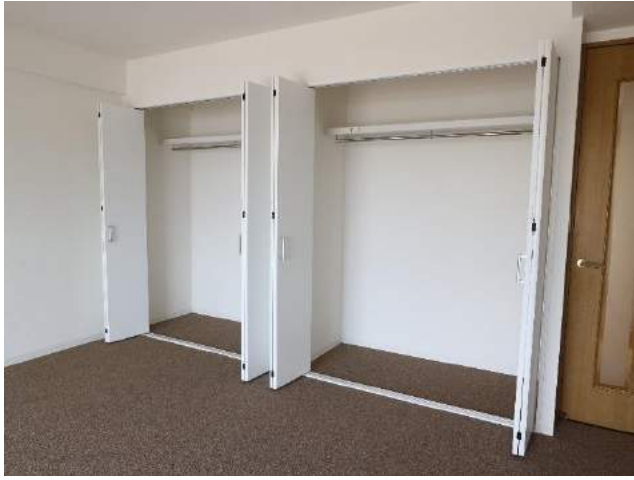
リビングにクローゼットを追加で収納不足を解消