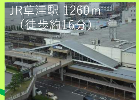
JR草津駅 1260m （徒歩約16分）