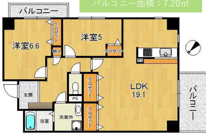
専有面積：71.40㎡（壁芯） バルコニー面積：7.20㎡