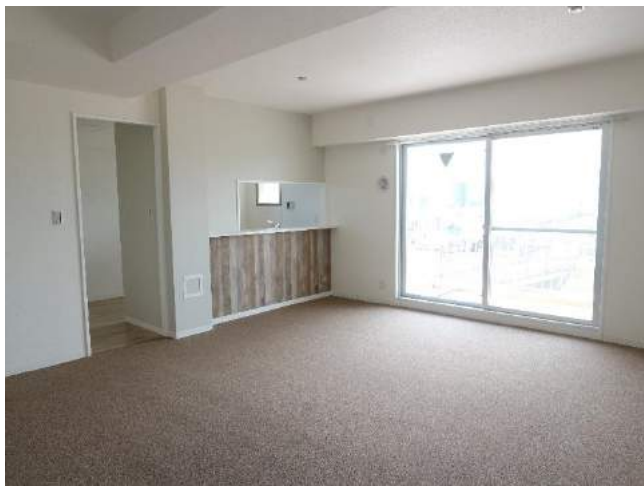
広々19.1帖のLDKはロケーションと合わせり開放感のあるお部屋になっています