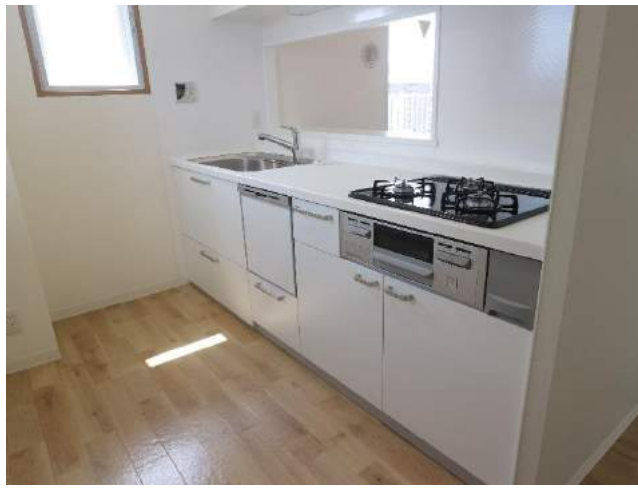
リビングダイニングだけでなくキッチンまで明るい室内