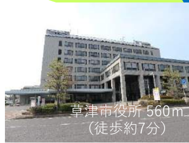
草津市役所 560m （徒歩約7分）