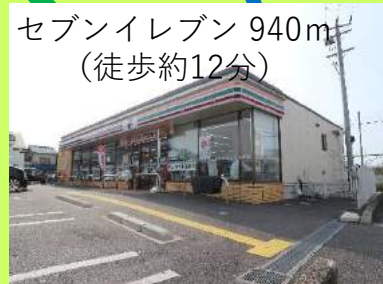
セブンイレブン 940m （徒歩約12分）