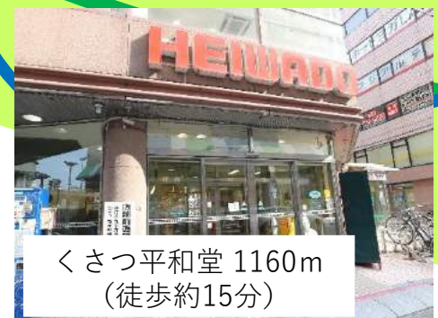
くさつ平和堂 1160m （徒歩約15分）