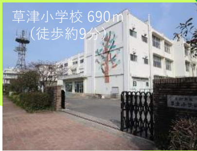
草津小学校 690m （徒歩約9分）

子育てに悩まれていたり、雑多な生活環境や日々のストレスにお疲れの方、開放的なロケーションで暮らしてみませんか。気晴らしに散歩するもよし、ランニングやロードバイクを趣味にして汗を流し、日々のストレスも洗せば心も体も健康に♪