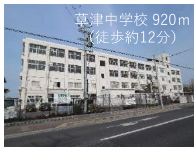
草津中学校 920m （徒歩約12分）