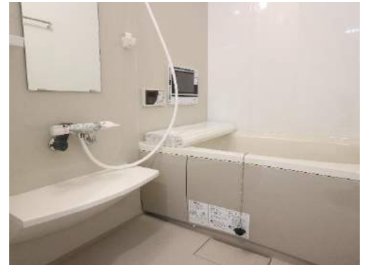
水回りは全てリフォーム済み